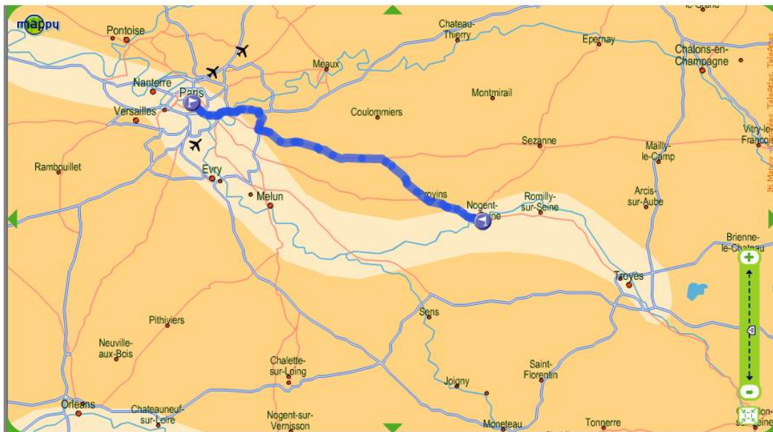
Paris - Nogent-sur-seine